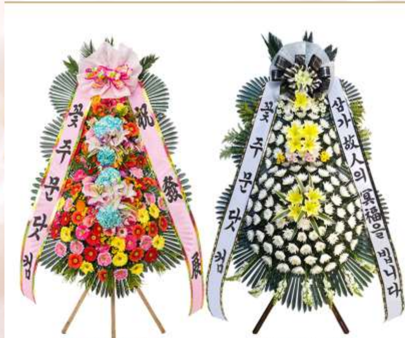
특별한 자리를 더욱 빛내줄 꽃주문닷컴 프리미엄 생화 축하화환