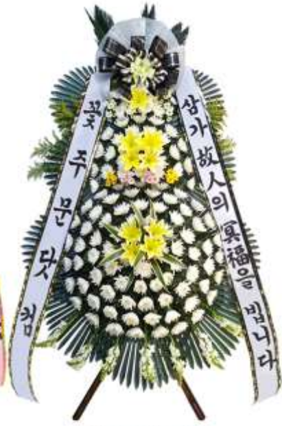
깊은 애도의 마음을 담아 꽃주문닷컴 프리미엄 생화 근조화환